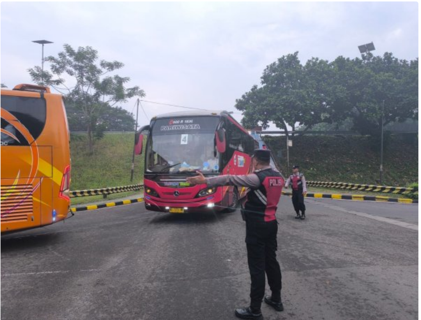
Polsubsektor Terminal Kargo Bandara Soetta Sedang melakukan pengamanan jalur keberangkatan jamaah Haji,26/5/24

TANGERANG - Polsubsektor Terminal Kargo Bandara Soekarno-Hatta (Soetta) memberikan pelayanan ekstra yakni berupa pengamanan jalur keberangkatan